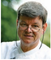
HARALD WOHLFAHRT SCHWARZWALDSTUBE Allemagne