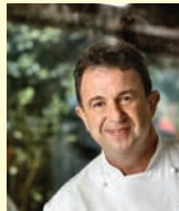
MARTIN BERASATEGUI Rest. MARTIN BERASATEGUI - Espagne