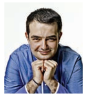
JEAN-FRANCOIS PIEGE LE GRAND RESTAURANT France