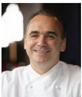
JEAN-GEORGES VONGERICHTEN Rest. JEAN-GEORGES - USA