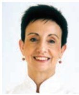
CARME RUSCALLEDA SANT PAU Espagne