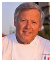
GEORGES BLANC Rest. GEORGES BLANC France