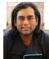
ANAND GAGGAN Rest. GAGGAN Thaïlande