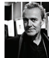
ALAIN PASSARD L'ARPEGE France