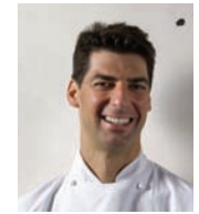
MASSIMILIANO ALAJMO LE CALANDRE Italie