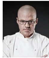
HESTON BLUMENTHAL THE FAT DUCK Royaume-Uni