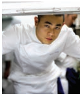
ANDRE CHIANG Rest. ANDRE Singapour