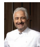
GUY SAVOY Rest. GUY SAVOY France