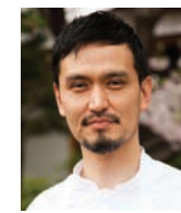
SHINOBU NAMAIE L'EFFERVESCENCE Japon