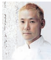
KEI KOBAYASHI Rest. KEI France