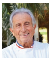
MICHEL GUÉRARD LES PRÈS D'EUGÉNIE France