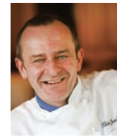
JEAN-GEORGES KLEIN VILLA RENÉ LALIQUE France