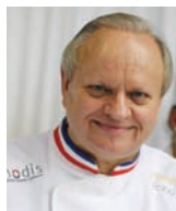
JOEL ROBUCHON L'ATELIER DE JOEL ROBUCHON - France