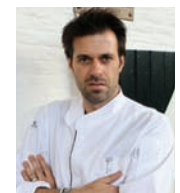
SERGIO HERMAN THE JANE Belgique