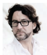
QUIQUE DACOSTA Rest. QUIQUE DACOSTA Espagne