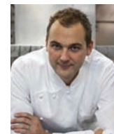
DANIEL HUMM ELEVEN MADISON PARK USA