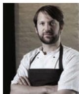
RENE REDZEPI NOMA Danemark