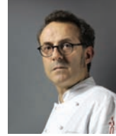
MASSIMO BOTTURA OSTERIA FRANCESCANA Italie