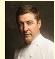
JOAN ROCA EL CELLER DE CAN ROCA Espagne