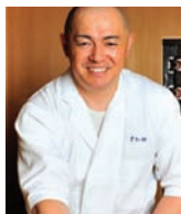
KOJI SAWADA SUSHI SAWADA Japon

LES 100 CHEFS AU MONDE CHEF QUI IL FAUT AVOIR ÊTRE