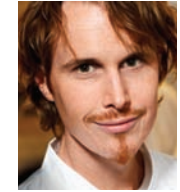
GRANT ACHATZ ALINEA USA