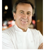
DANIEL BOULUD Rest. DANIEL BOULUD USA