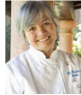
NADIA SANTINI DAL PESCATORE Italie