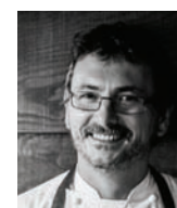
ANDONI LUIS ADURIZ MUGARITZ Espagne