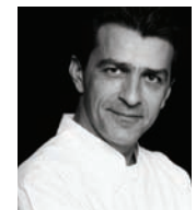
YANNICK ALLENO LEDOYEN France