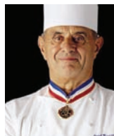
PAUL BOCUSE Rest. PAUL BOCUSE France