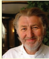
PIERRE GAGNAIRE Rest. PIERRE GAGNAIRE France