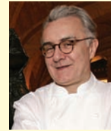
ALAIN DUCASSE LOUIS XV ALAIN DUCASSE Monaco