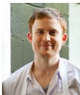
JOSHUA SKENES SAISON USA