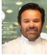
MICHEL TROISGROS Rest. TROISGROS France