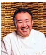
TETSUYA WAKUDA TETSUYA'S Australie