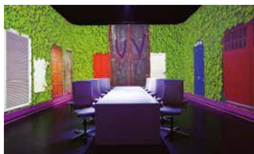
Expérience multisensorielle chez Ultraviolet.